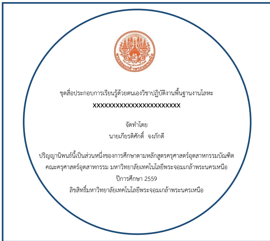
ตัวอย่างการกรีนข้อมูลลงบนแผ่น CD/DVD